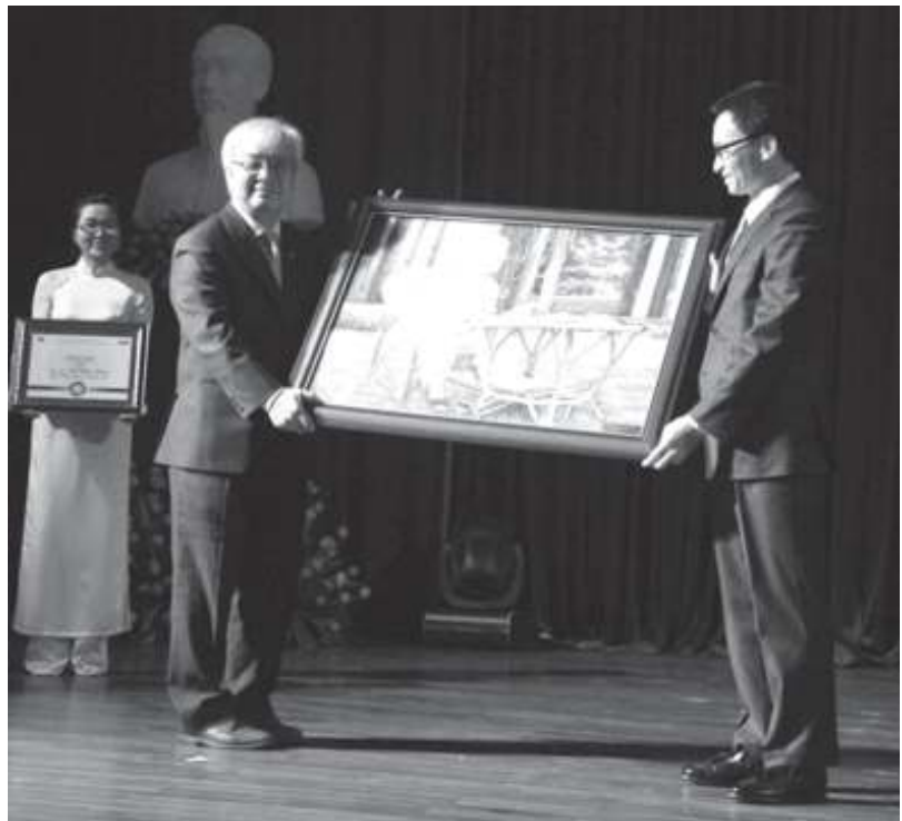
Phó Thủ tướng tặng ảnh Bác Hồ cho ĐHQG-HCM.

Đặt niềm tin vào sinh viên, Phó Thủ tướng nhấn mạnh: "Tất cả các bạn đều là niềm tin, hy vọng, tương lai của gia đình, người thân, dòng tộc và cả đất nước này. Tương lai của các bạn nằm trong tay chính các bạn. Tương lai của dân tộc này nằm trên bờ vai của chính các bạn. Chúng ta nói đất nước ta rừng vàng biển bạc, chúng ta nói nhiều thứ... Nhưng, lợi thế lớn nhất của chúng ta là con người. Đó là chính chúng ta, là các bạn sinh viên. Sinh viên là tiềm năng, lợi thế lớn nhất của dân tộc này trong cuộc đua tranh cùng thế giới..."