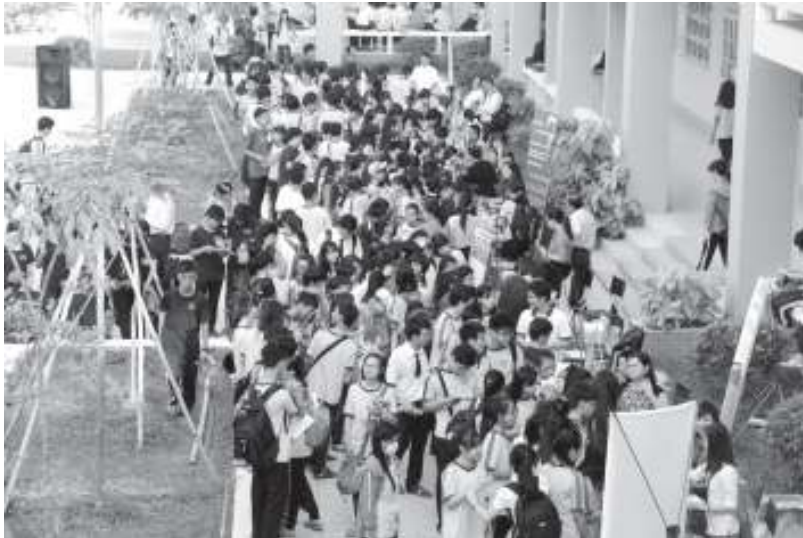
Học sinh quan tâm thông tin tuyển sinh của ĐHQG-HCM.

điểm các môn tương ứng trong kỳ thi THPT Quốc gia, hoặc môn năng khiếu; Dưu tiên = Điểm ưu tiên khu vực và đối tượng.