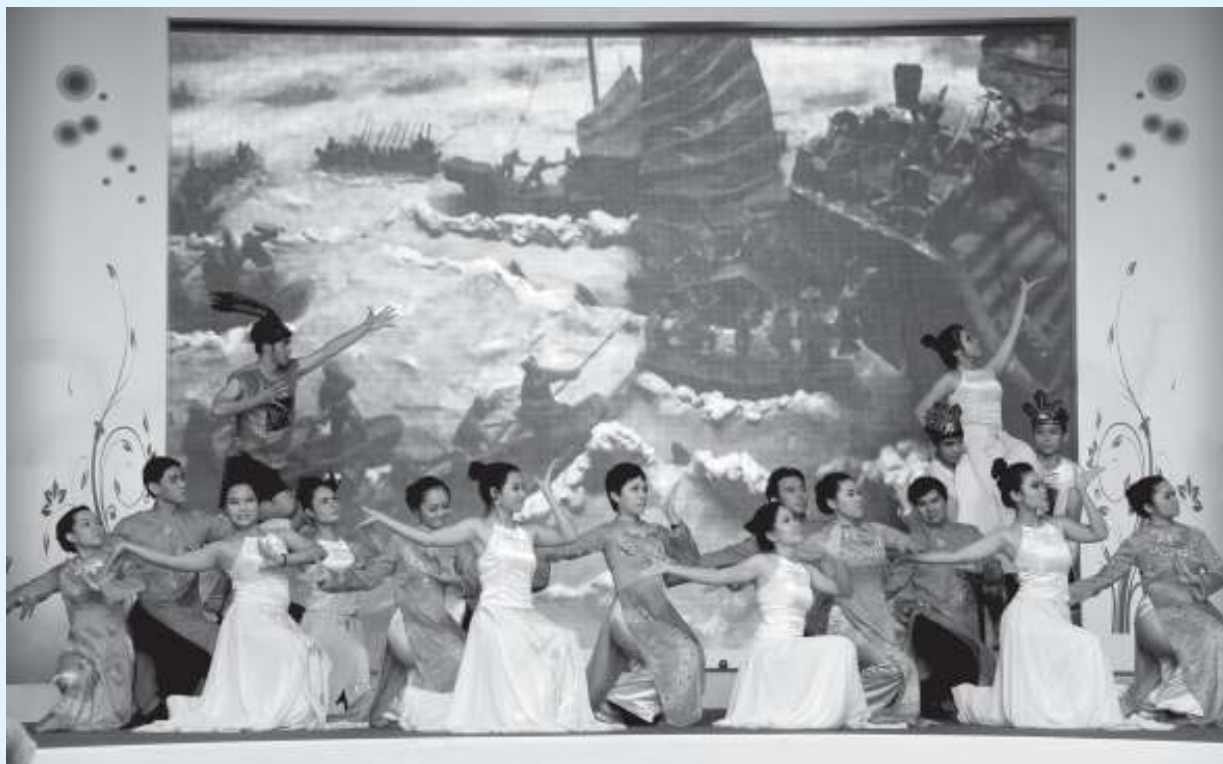
Hào khí Bạch Đằng.

Trong đêm đen, Cảng Sài Gòn, Nguyễn Tất Thành xuất dương tìm đường, Giữa mờ mịt, Xưởng Ba Son, Tôn Đức Thắng lập Công hội Đỏ. Cờ Đảng, phong trào như điều gặp gió