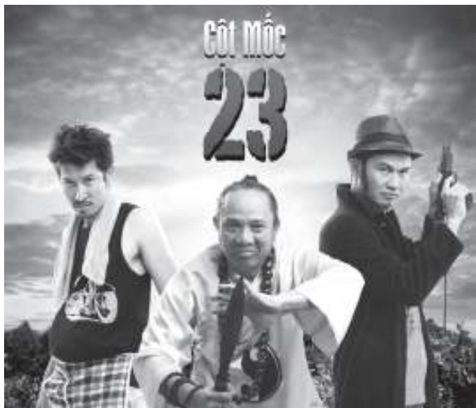
Dù không gây được nhiều ấn tượng với khán giả, song Cột mốc 23 vẫn có doanh số phòng vé cao.

Có lẽ ít ai biết, kinh dị là một trong những thể loại lâu đời nhất của điện ảnh Việt Nam. Nhưng quá trình phát triển ngắt quãng và không được quan tâm đúng mức, chất lượng của dòng phim này, dù đang có dấu hiệu hồi sinh trong những năm gần đây, vẫn chưa tương xứng với tuổi đời của nó.