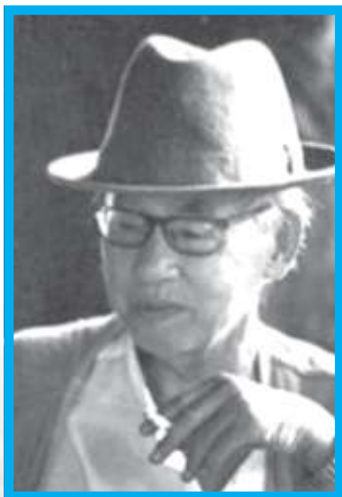
Kiên Giang - Hà Huy Hà.

Đọc bài Nhạc xe bò ta tưởng như nghe được tiếng đất vọng, thấy được ánh trăng mờ tịch tịch, hình dung ra đường khuya heo hút với hàng cây già nua. Xe chở nặng, bước chân bò cũng nặng thêm, tình người và tiếng nhạc