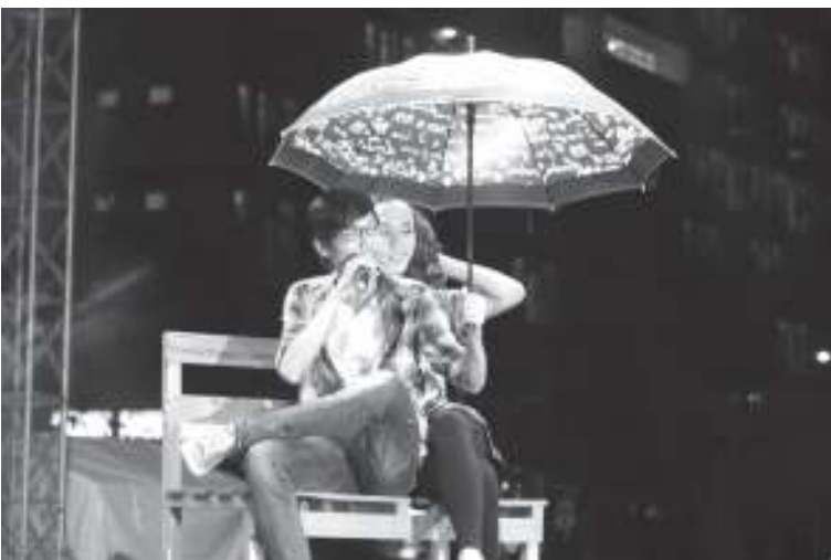
Tiết mục kịch của sinh viên đại học Kinh tế - Luật (ĐHQG-HCM) đạt giải Sáng tạo.