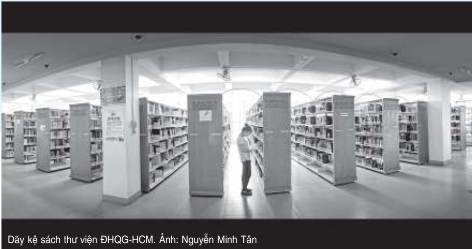
Dãy kệ sách thư viện ĐHQG-HCM.

chính phẩm thì đồng thời lại có sự bùng ra thoải mái cho các sách phụ trợ, thứ phẩm.