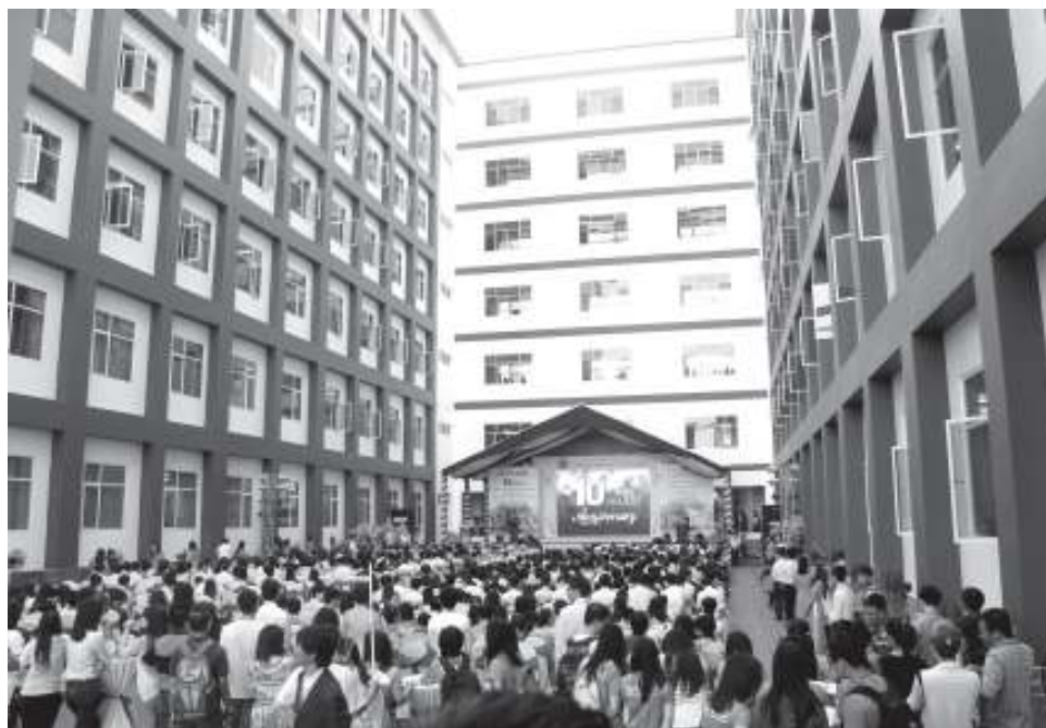
Trường ĐH Quốc tế ĐHQG-HCM phát triển theo mô hình tự chủ tài chính.

Điều 32 Luật GDDH quy định: "Cơ sở giáo dục đại học tự chủ trong các hoạt động chủ yếu thuộc các lĩnh vực tổ chức và nhân sự, tài chính và tài sản, đào tạo, khoa học công nghệ, hợp tác quốc tế, bảo đảm chất lượng giáo