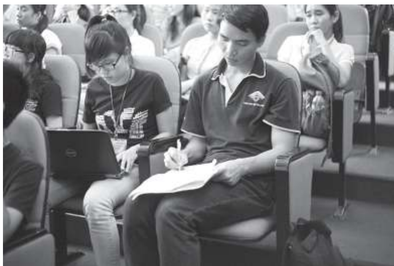
Sinh viên Khoa BC&TT trong giờ học chuyên ngành.

Người làm báo không nhất thiết phải có khả năng văn chương