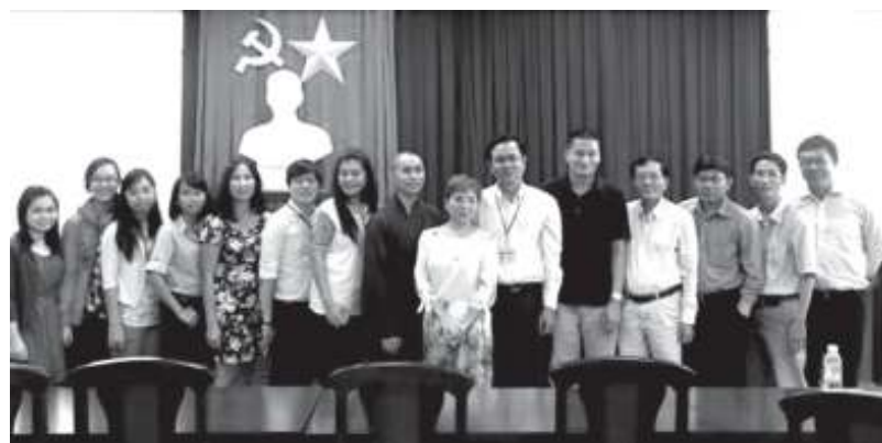
Các đại biểu tham dự buổi tọa đàm.

cái gọi là Vật tổ chỉ là một cách định danh trong phân loại xã hội học mà thôi. Trước sự thiếu cập nhật lý thuyết của nhiều nhà khoa học Việt Nam, gần đây Dortier đã tái khẳng định: “Sau khi giữ một vai trò lớn, thờ Vật tổ đã bị vứt bỏ, bị đưa xuống hàng những ảo giác về quá khứ. Một ảo giác khoa học cho thấy rằng các nhà tộc người học cũng có những tín ngưỡng và huyền thoại của họ” (Dortier 2004/2009).