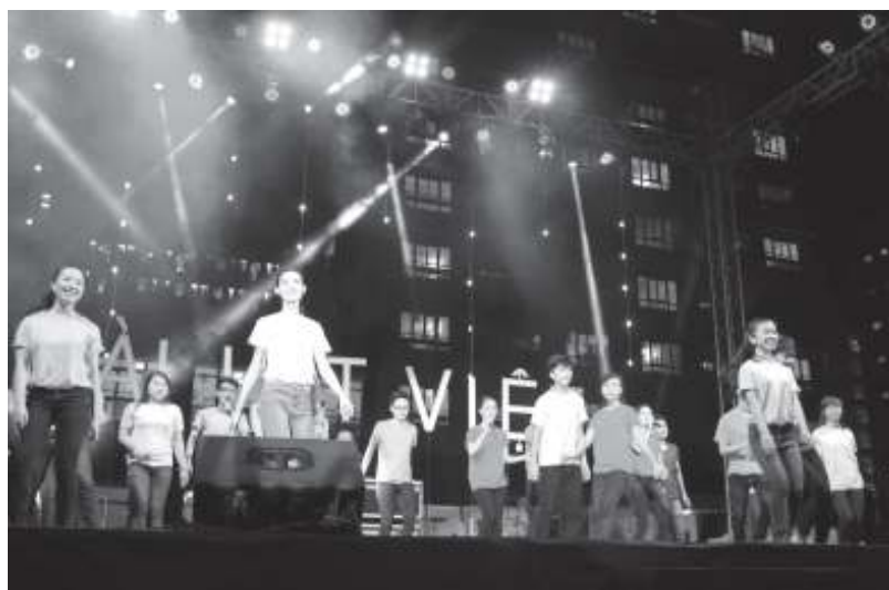
Tiết mục mở màn đêm Gala của sinh viên đại học Kinh tế - Luật (ĐHQG-HCM).

còn khuyến khích các bạn có niềm đam mê viết nhạc gửi bài hát sáng tác của mình về cho Bài hát Việt.