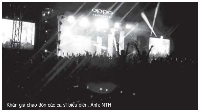
Khán giả chào đón các ca sĩ biểu diễn.

Ngày hội đã để lại ấn tượng sâu đậm trong lòng của hơn 10 ngàn sinh viên tham dự ■