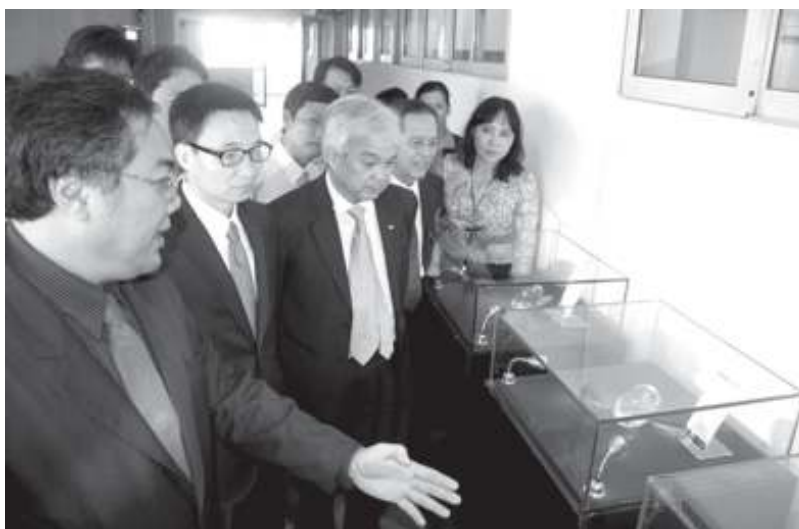
Phó Thủ tướng Vũ Đức Đam thăm Trung tâm ICDREC.

ĐHQG-HCM về những khó khăn trong việc giải phóng mặt bằng, chảy máu chất xám, Phó Thủ tướng cũng bày tỏ sự ủng hộ về cơ chế và vấn đề tự chủ của ĐHQG-HCM. Đồng thời, Phó Thủ tướng đề nghị, với những thành quả đáng tự hào bước đầu, ĐHQG-HCM cần xác định mốc thời gian nhất định để có thể gia nhập cộng đồng các đại học lớn trên thế giới ■