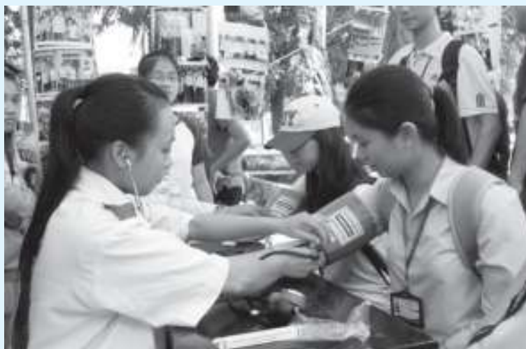
Sinh viên khoa Y khám bệnh cho sinh viên trong ngày hội.

khăn. Ban đầu, cô cũng la lớp dữ lắm. Nhưng rồi thấy lớp chăm chỉ, chịu khó giờ tay làm bài tập, cô cũng bớt la. Sau một tháng tích cực ôn luyện, lớp tôi tiến bộ hẳn lên.