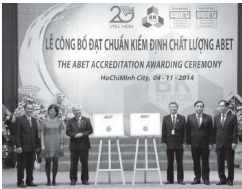
Trường ĐH Bách Khoa đón nhận chứng nhận hai chương trình đạt chuẩn ABET.

Ngày 4/11 tại Trường ĐH Bách Khoa (ĐHQG-HCM), ĐHQG-HCM đã công bố hai chương trình đạt chuẩn ABET. Đại diện Bộ Giáo dục và Đào Tạo, Lãnh sự quán Hoa Kỳ tại TP.HCM, các trường khối ngành kỹ thuật, các công ty cũng đã đến dự lễ công bố.