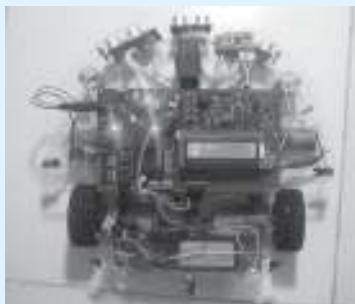
Robot hút bụi tự động của đội CENIT.

Vậy có cần xin phép khi trích dẫn hay không? Theo TS. Nam Giang, trích dẫn hợp lý tác phẩm để bình luận hoặc minh họa; trích dẫn tác phẩm để viết báo, dùng trong ấn phẩm định kỳ, trong chương trình phát thanh, truyền hình, phim tài liệu; trích dẫn chỉ nhằm mục đích giới thiệu, bình luận hoặc làm sáng tỏ vấn đề được đề cập trong tác phẩm; trích dẫn giảng dạy trong nhà trường; phần trích dẫn không gây phương hại tới quyền tác giả đối với tác phẩm được sử