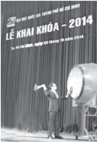
Phó Thủ tướng đánh trống khai khóa 2014.

C hủ đề Lễ khai khóa 2014 là "Đổi mới căn bản, toàn diện giáo dục đại học Việt Nam trong thời kỳ hội nhập và vai trò của ĐHQG-HCM".