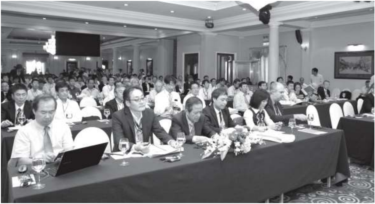
Các đại biểu tham dự hội nghị.