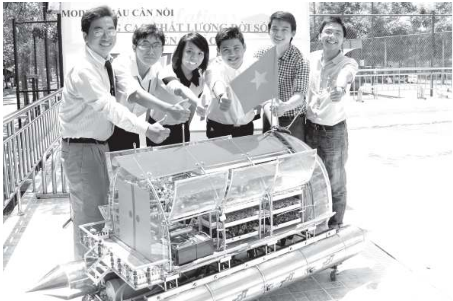
Nhóm tác giả và mô hình Mô-đun hậu cần nổi 1/5 Version 2.0.