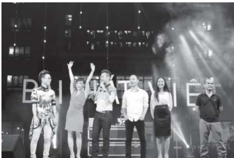
5 vị giám khảo của chương trình Gala Bài hát Việt với Sinh viên.

Được biết, chương trình không chỉ là cơ hội để sinh viên giao lưu với các ca sĩ, nhạc sĩ mà