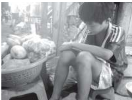
Tý tranh thủ ôn bài.