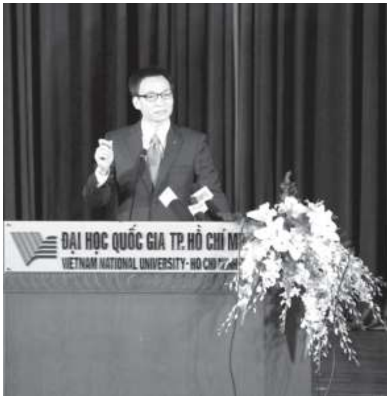
Phó Thủ tướng Vũ Đức Đam nói chuyện với sinh viên ĐHQG-HCM.

Sáng ngày 3/10, Phó Thủ tướng Vũ Đức Đam đã tham dự Lễ Khai khóa và có buổi làm việc với cán bộ chủ chốt ĐHQG-HCM về tình hình xây dựng - phát triển ĐHQG-HCM.