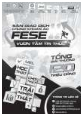
Poster chính thức của FESE mùa thứ 11.