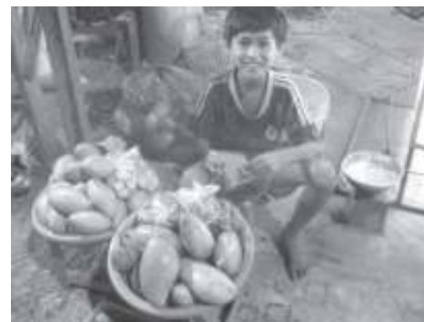
Tý bên thúng xoài ở chợ đêm sinh viên.

càng đông hơn. Đây là thời điểm vàng cho các cô chú bán hàng kiếm thu nhập. "Chị ơi! Anh ơi! Mua giùm em xoài, khoai nha!". Tôi như đứng sững lại khi nghe giọng nói đứa nhỏ nào rao bán. Giọng lạnh lạnh, có chút gì đó như nài nỉ. Đảo mắt một vòng, vẫn không thấy người. Đi tiếp một quãng, tôi mới nhận ra đứa nhỏ. Nó ngồi trong một góc hẹp, dưới trụ điện đèn đường. Chỗ nó ngồi chỉ tầm một ô vuông đủ để đặt cái thúng xoài, cái bao và chiếc đèn nhỏ. Làn khói gà nướng của quán kế nó ngồi, phun đen trùm cả khoảng không rộng. Chân nó không đi dép. Nó mặc chiếc quần đùi củ rích và chiếc áo rách vai, khuôn mặt gầy gò, da đen đen, miệng vẫn rao bán nhưng tay và mắt cúi xuống đất như để tránh làn khói cay xèm. Đúng hơn là tay nó cầm mẫu than củi vạch cái gì đó trên mặt đất?