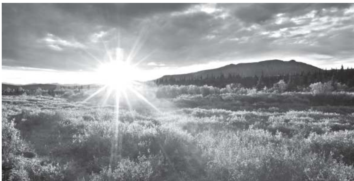
Ảnh minh họa.

Khi ta hướng về ánh mặt trời thì ánh sáng tất sẽ chan hòa trên khuôn mặt. Khi ta hướng về đổi mới căn bản và toàn diện giáo dục - đào tạo thì mùa xuân của Tổ quốc sẽ hiện ra trước mắt. Và khi một nền giáo dục bắt đầu từ sự tôn trọng người dạy và người học, thì đất nước sẽ cất cánh trong tương lai ■