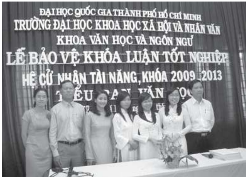
Lễ bảo vệ khóa luận tốt nghiệp hệ CNTT khóa 2009-2013 của Khoa Văn học và Ngôn ngữ.

bị cho những người bạn trẻ cái tư thế vững vàng để vào đời: bước ra ngoài cửa lớp là mưu sinh, họ phải sống cái cuộc sống của hôm nay, một cuộc sống đầy thử thách và bất trắc, trong khi hành trang lên đường của họ lắm khi vừa công kênh thừa thãi vừa thiếu sót bất cập.