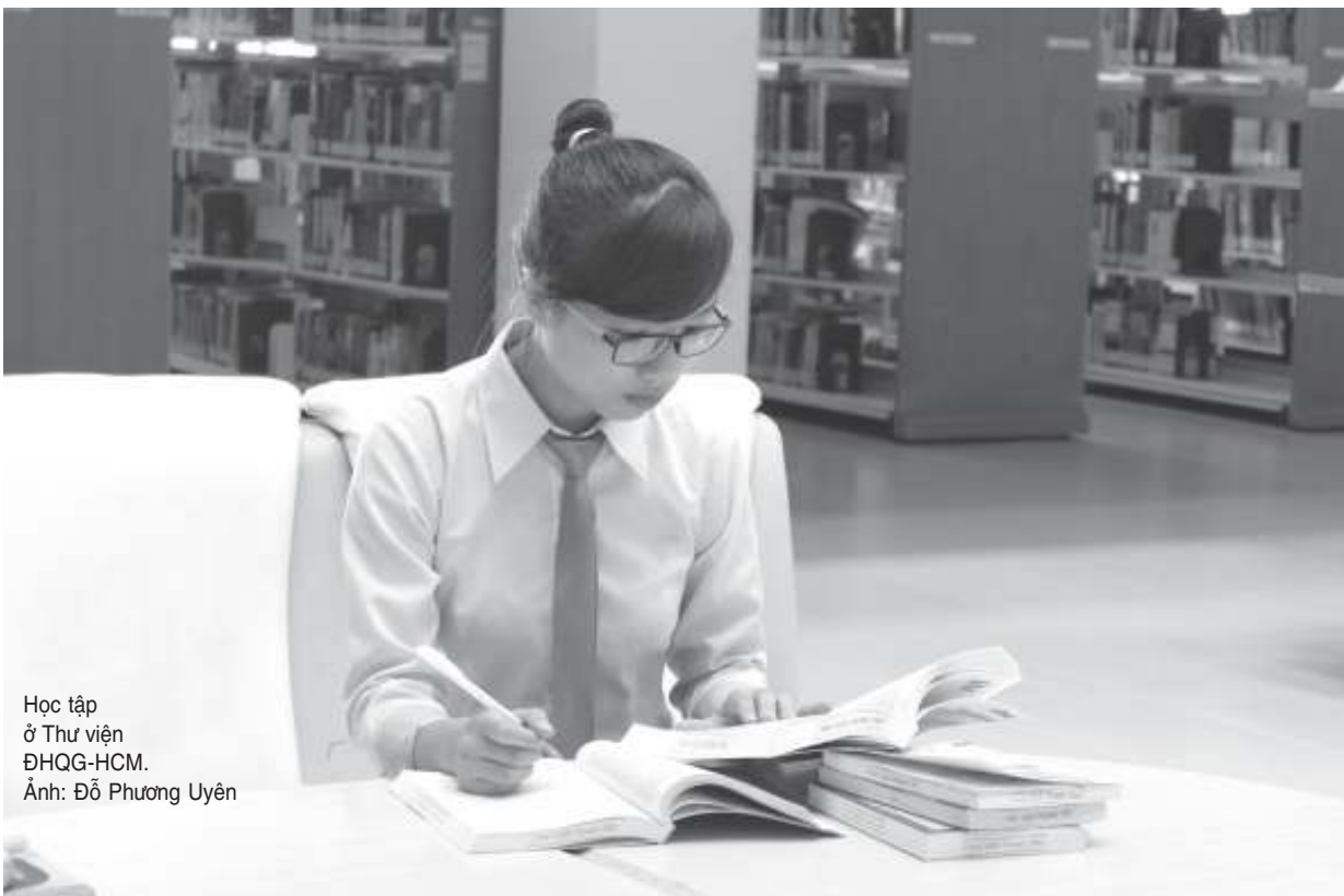
Học tập ở Thư viện ĐHQG-HCM.