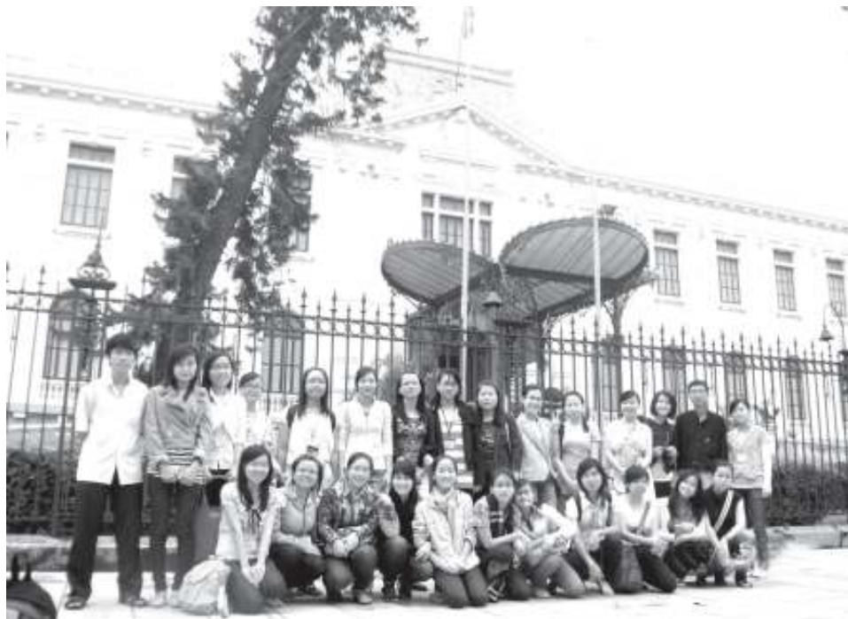
SV lớp CNTN 2009-2013 thực tập thực tế tại Hà Nội.

Xây dựng một chương trình văn học vừa đáp ứng nhu cầu của xã hội, vừa phù hợp điều kiện