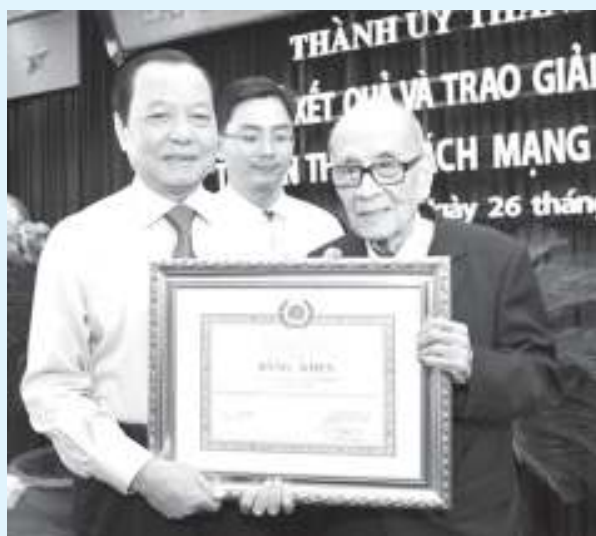
Bí thư Thành ủy TP.HCM Lê Thanh Hải tặng bằng khen cho Giáo sư - Anh hùng Lao động Vũ Khiêu (đoạt giải Nhì).

Sáng 25/10, Thành ủy TP.HCM tổ chức Lễ công bố kết quả và trao giải cuộc vận động sáng tác Văn bia “Truyền thống Cách mạng Sài Gòn - Chợ Lớn - Gia Định”.