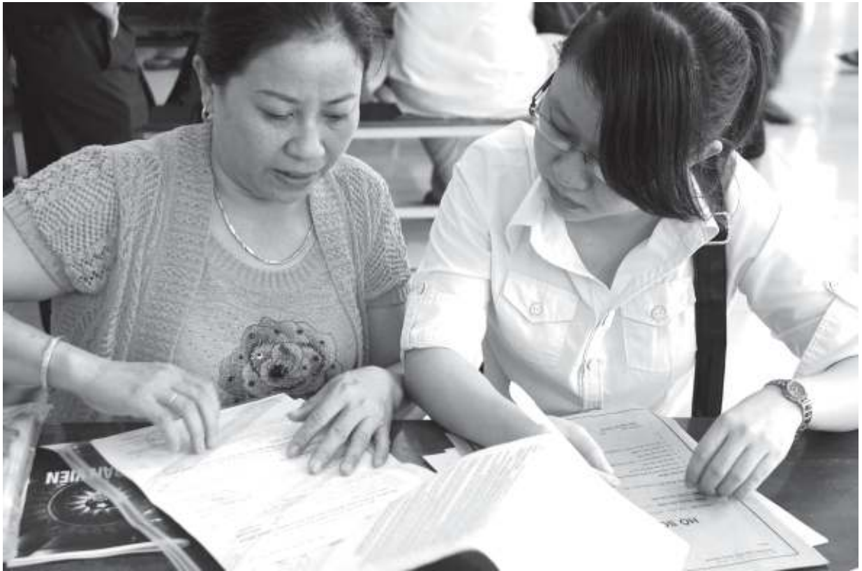
Ảnh minh họa.