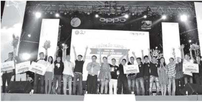
Lễ trao giải cuộc thi Liên hoan Ban nhạc Sinh viên TP.HCM lần I.

Thông tin, Phobia và The Way của Đại học Kinh tế... đã để lại ấn tượng đẹp trong lòng ban giám khảo và người xem bởi sự trẻ trung và tài năng của mình. Kết quả: The Friends Band của CLB Nốt Nhạc Xanh đã xuất sắc giành vị trí quán quân.