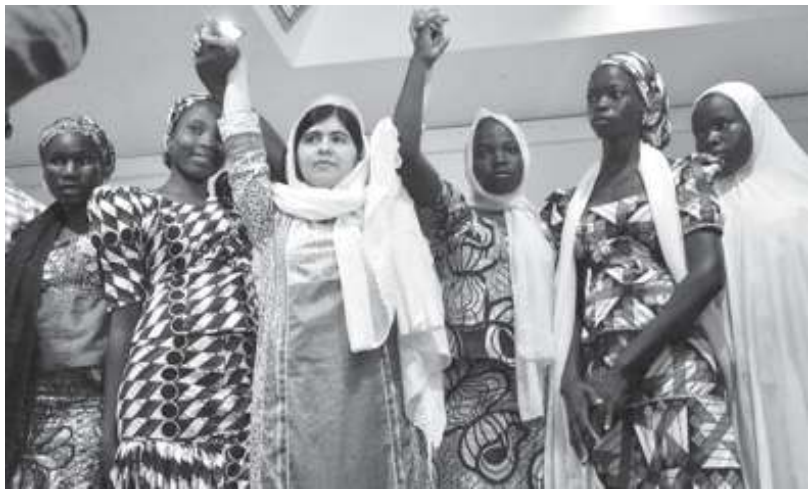
Malala tại Ajuba, Nigeria ngày 14/7/2013.