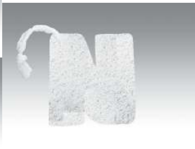
Vài mẫu bông tắm xơ mướp Quỳnh Hoa thiết kế.