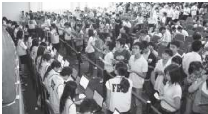
Đông đảo sinh viên tham gia FESE mùa thứ 10.