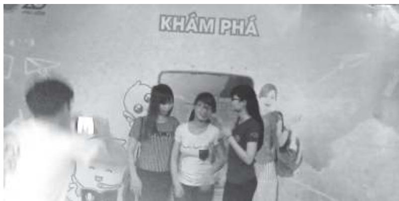
Sinh viên tham gia gian hàng trò chơi.

14 giờ sân khấu ngoài trời trở nên sôi động và nhiều sắc màu bởi các ban nhạc sinh viên đến từ các trường khác nhau tham gia vòng chung kết Liên hoan Ban nhạc Sinh viên TP.HCM lần I. Các ban nhạc The Friends Band của CLB Nốt Nhạc Xanh, 2K Band của Đại học Văn hiến, The Galaxy Band của Cao đẳng Kinh tế - Kỹ thuật Phú Lâm, 1973 Band của Đại học Công nghệ