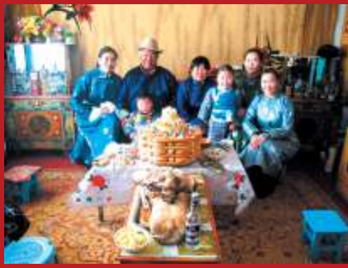
Mâm cỗ của Mông Cổ. Ảnh: TL