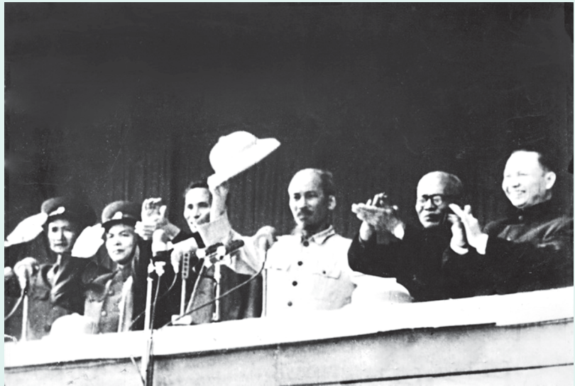
Chủ tịch Hồ Chí Minh trở về Thủ đô năm Ất Mùi 1955. Ảnh tư liệu.

* Ất Mùi 1955: Ngày 1/1, người dân Hà Nội nhiệt liệt đón mừng Hồ Chủ tịch, Trung ương