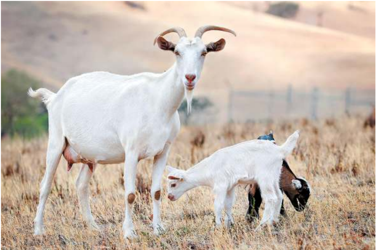
Con dê tự nhiên