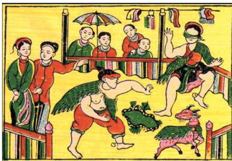
Bịt mắt bắt dê (tranh dân gian Đông Hồ, thế kỷ XVII).

Theo điển chế nhà Nguyễn, con dê là một trong số các loài vật