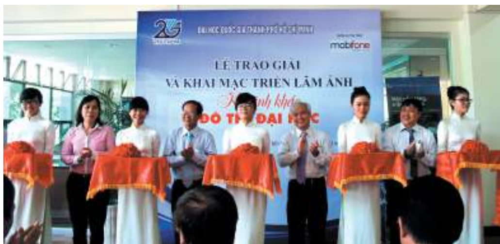
Các đại biểu cắt băng khánh thành triển lãm.

Cuộc thi nhằm ghi lại những dấu ấn xây dựng và phát triển của ĐHQG-HCM trong 20 năm qua. Sau hơn ba tháng triển khai (tháng 8-11/2014), Ban tổ chức nhận được 500 tác phẩm của 75 tác giả đến từ Hội