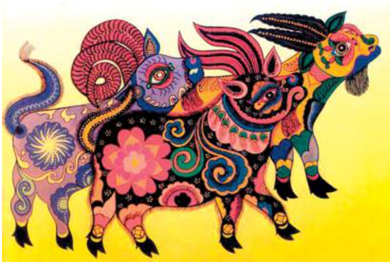
Tam dương khai thái

15 tháng Giêng đều phải dâng cúng thần linh một con dê và một con chó. Da dê sau đó được cắt ra làm bùa hộ mạng, phụ nữ thì coi miếng da dê có thần phép hỗ trợ sinh nở. Trong thần thoại Bắc Âu, Thần Thor cưỡi trên một cỗ xe dê kéo mỗi khi du ngoạn nhân gian.