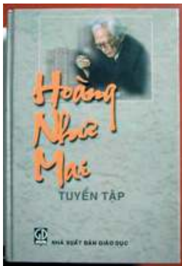
Bìa cuốn Tuyển tập của Hoàng Như Mai.