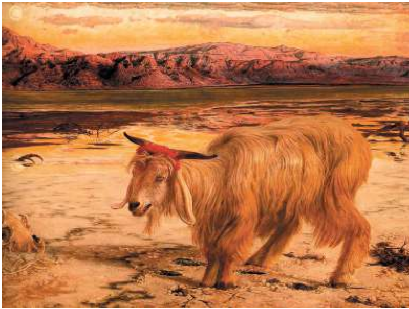
Con dê gánh tội