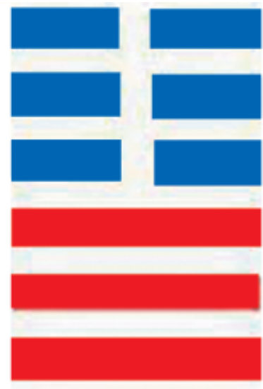
Quẻ Thái trong Kinh Dịch

Trong nhiều nền văn hóa, con dê (cừu) gắn liền với cuộc sống thường nhật, vì vậy chúng nhẹ nhàng đi vào lối sống văn hóa và nghệ thuật. Tranh tết là kết tinh của trí tuệ và những mong muốn tốt đẹp đầu năm. Tranh tết năm Mùi có hai mô-típ thường thấy nhất, một là một con dê sừng cong đầy đặn, biểu tượng của sung túc, thịnh vượng, hai là nhóm ba con dê quay quàn hạnh phúc. Mô-típ thứ hai được cho là bắt nguồn từ câu thành ngữ “Tam dương khai thái”. Trên thực tế, câu “Tam dương khai thái” không liên quan đến ba con