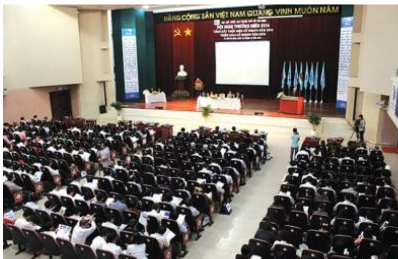
Toàn cảnh Hội nghị Thường niên 2014.

Sáng 25/12, ĐHQG-HCM đã tổ chức Hội nghị Thường niên 2014. Hội nghị đã thông qua Báo cáo tổng kết hoạt động 2014, Kế hoạch hoạt động 2015, Định hướng xây dựng Kế hoạch chiến lược giai đoạn 2016-2020 và tầm nhìn 2030. Năm 2015, ĐHQG-HCM lấy chủ đề là "Đổi mới và Hội nhập" và Kế hoạch chiến lược giai đoạn 2016-2020 lấy trọng tâm là Đảm bảo chất lượng đào tạo.