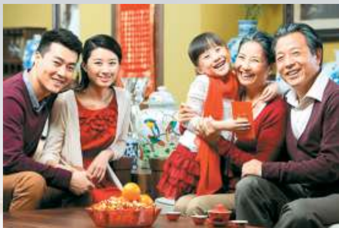
Tết đến xuân về là lúc gia đình sum họp.