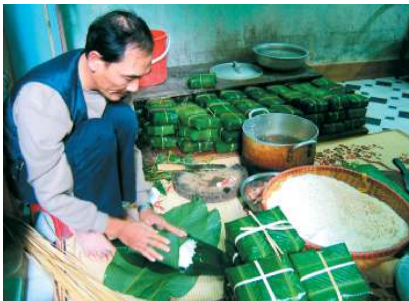
Gói bánh chưng ngày Tết. Nguồn Internet

Mẹ đi làm thuê làm mướn hết trên đồi mía rồi xuống ruộng ngô. Những ngày cuối năm mưa rả rích, gió lạnh thấu da thấu thịt, ấy thế mà mới bốn, năm