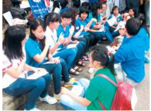
SV thể hiện bài hát bằng NNKH.