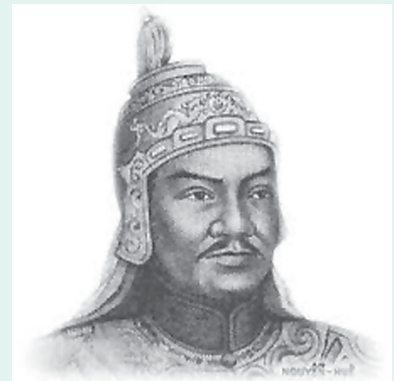
Nguyễn Huệ và cuộc khởi nghĩa Tây Sơn toàn thắng năm Đinh Mùi 1787.

Tây Sơn nhanh chóng lớn mạnh, đánh đuổi chúa Nguyễn vào Nam rồi tiến ra Bắc để tiêu diệt tập đoàn chúa Trịnh.