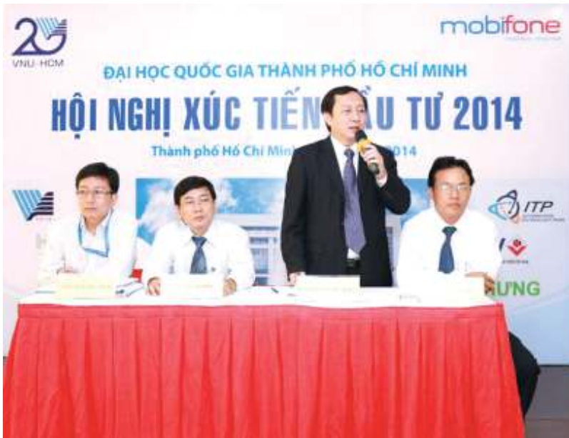
Các nhà đầu tư thảo luận tại Hội nghị.

“ Chúng tôi cam kết và nỗ lực đồng hành đến cùng với các nhà đầu tư trong mỗi dự án. Đầu tư cho giáo dục theo hình thức PPP đang và sẽ là lựa chọn tất yếu của ngành giáo dục nói chung và của ĐHQG-HCM nói riêng nhằm xây dựng những trung tâm giáo dục đủ sức, đủ tầm để sánh vai với các nước trên thế giới