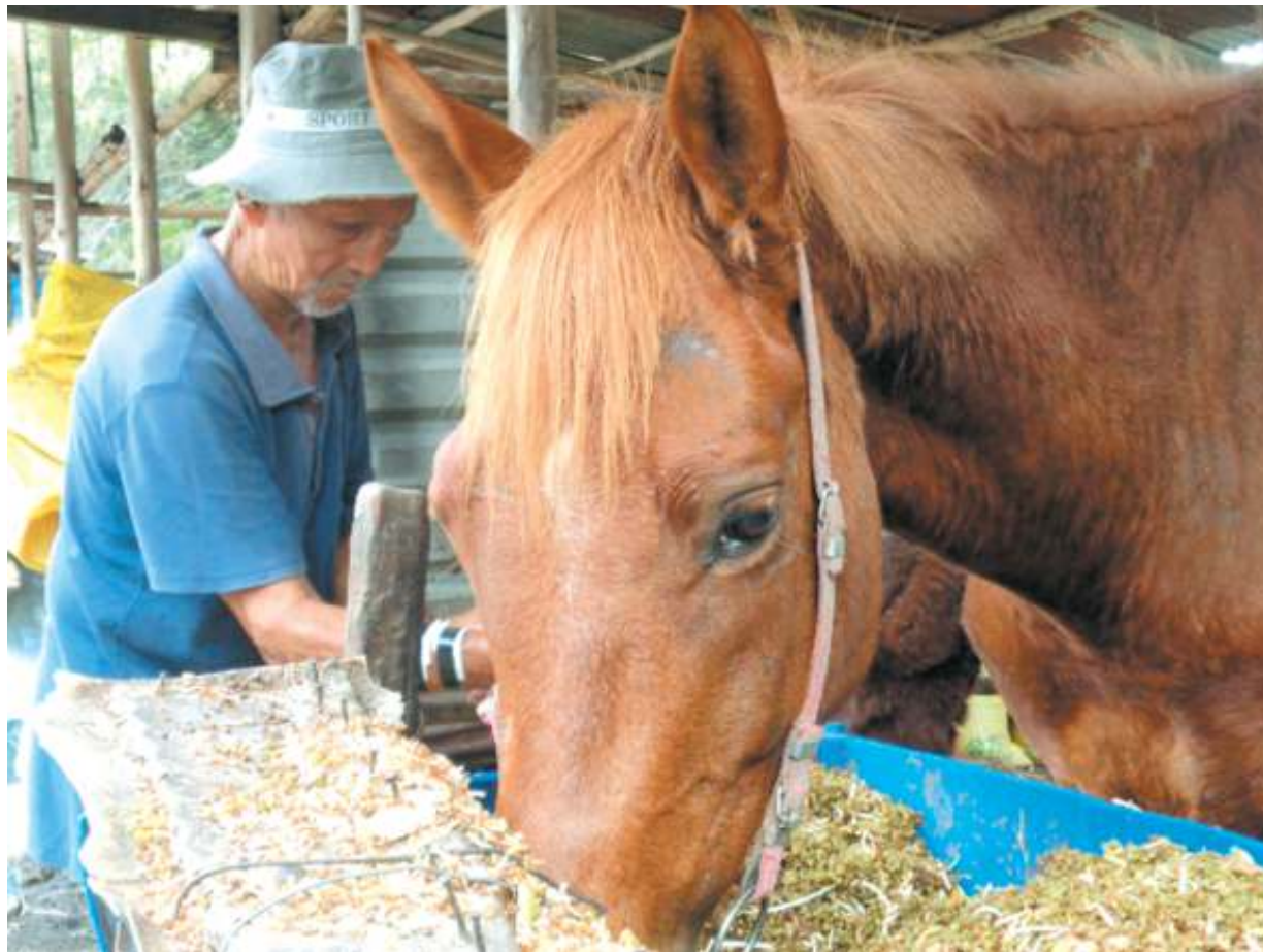
Cứ đúng 11 giờ là ông dẫn ngựa về chuồng.