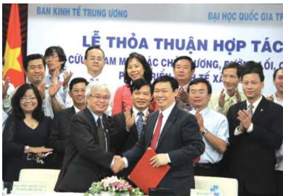
ĐHQG-HCM và Ban Kinh tế Trung ương ký kết thỏa thuận hợp tác.