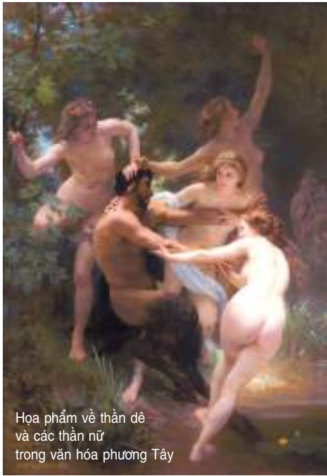
Họa phẩm về thần dê và các thần nữ trong văn hóa phương Tây

được dùng trong việc tế lễ. Sách Đại Nam Thực Lục Chính Biên có ghi chép rằng vua Minh Mạng sai mua 220 dê đực và 100 dê cái, chọn 20 con dê đực giao Tế sinh làm lễ vật tế lễ Nam Giao vào năm 1836; chính vì thế dân gian có câu: Bốn cửa anh chạm bốn dê, bốn con dê đực châu về tổ tông.