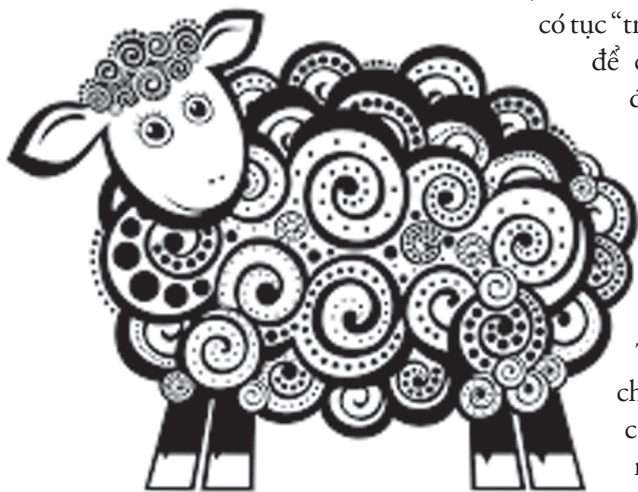
Biểu tượng cừu năm Mùi 2015 trong văn hóa Đông Bắc Á

Từ “duang” để chỉ dê (cừu) trong văn hóa Á Đông đồng âm với từ “duang” trong triết lý âm dương, vì vậy người Trung Hoa vùng Hebei có tục “tống duang”, xưa thường là ông ngoại hay cậu tặng cháu trai con cừu sống, sau chuyển thành tặng thiệp hình cừu. Tục này được gắn với tích Nhi Lang Thần Dương Tiễn trao tặng cháu trai Trầm Hương một cặp cừu để kết nối tình cảm (vì trước đây Dương Tiễn đã quyết tâm trừng phạt chị gái là mẹ Trầm Hương trong tích Bảo Liên Đãng ). “Tặng cừu/tống duang” mang hàm ý trao tặng duang khí , trao tặng sự may mắn, thịnh vượng .