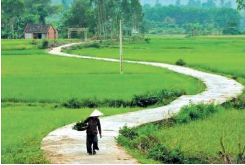
Ảnh minh họa: Nguồn Internet.

cao nhất và vị ngon nhất có lẽ là những dây khoai được trồng trên vùng đất cát trắng bạt ngàn như ở quê tôi, chẳng phải ông bà ngày xưa đã từng nhắn nhủ cho con cháu phương pháp trồng khoai qua câu ca dao này sao: