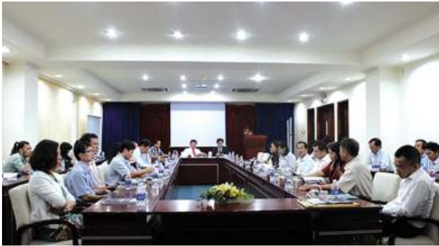
Các đại biểu chia thành 6 tổ thảo luận.