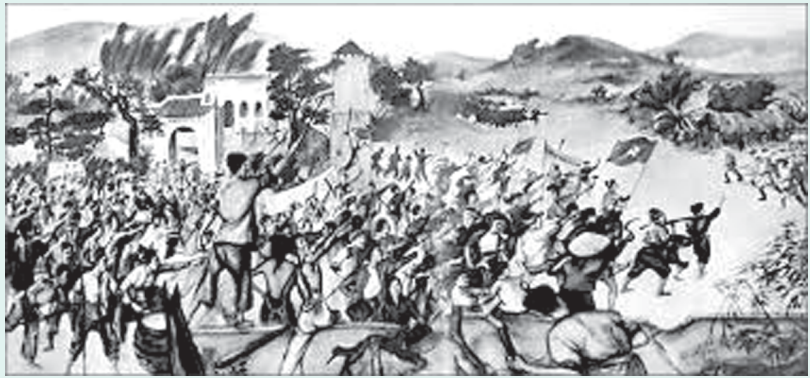
Phong trào Xô Viết Nghệ Tĩnh năm Tân Mùi 1931.

* Quý Mùi 1283: Vua Trần tổ chức tập trận thủy bộ quy mô lớn, trao quyền thống lĩnh quân đội cho Trần Hưng Đạo, gấp rút chuẩn bị lực lượng để kiên quyết chống trả 50 vạn quân Nguyên