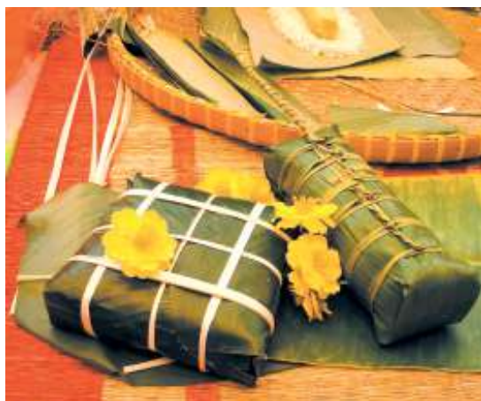
Bánh tét, bánh chưng của Việt Nam.