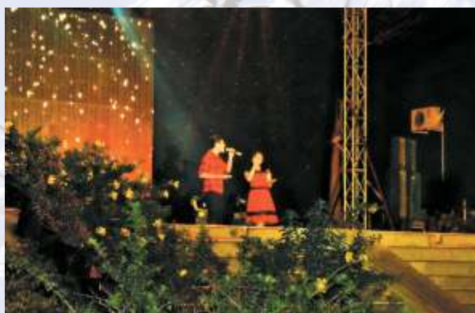
Sinh viên biểu diễn văn nghệ chào năm mới 2015.

Ngày 31/12, Ký túc xá ĐHQG-HCM đã phối hợp với nhiều đơn vị tổ chức Lễ hội chào năm mới 2015 với chủ đề "Rộn ràng sắc xuân". Lễ hội được tổ chức ở cả KTX Khu A và Khu B với nhiều nội dung hấp dẫn, kéo dài đến đầu năm 2015, tạo nên không khí ấm áp, tươi vui cho sinh viên ĐHQG-HCM.