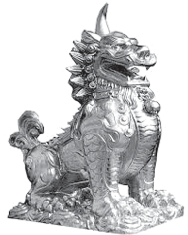
Hải trãi - linh vật biểu trưng của công lý, có năng lực phân biệt chính - tà.

Theo quan niệm phong thủy phương Đông, con dê còn là biểu tượng của sự kiên trì vượt khó và nhanh trí. Việc bài trí dê tại bàn làm việc được cho là gợi ý cho chủ nhân luôn giữ được sự điềm đạm, tĩnh tâm, tốt cho các mối quan hệ giao tiếp. Bài trí biểu tượng dê cũng có thể tăng thêm ý chí và sự kiên nhẫn cũng như bồi đắp lòng kiên trì phấn đấu.