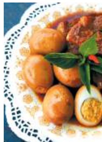
Thịt kho trứng nước dừa của

Tết là dịp để con người trở về cội nguồn. Ai dù có đi đâu xa vào ngày này cũng cố trở về nhà để được sum họp dưới mái ấm gia đình, thăm phàn mộ tổ tiên, gặp lại họ hàng, làng xóm. Do tương cận về văn hóa, ngày Tết truyền thống ở một số quốc gia cũng có nét gần gũi với Tết Nguyên đán của Việt Nam