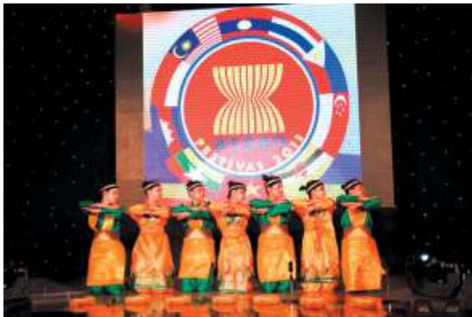
Sinh viên ĐHQG-HCM tham gia Festival ASEAN tại ĐHQG-HCM. Ảnh tư liệu.

Ông Surin Pitsuwan - nguyên Tổng thư ký ASEAN tại Diễn đàn sáng kiến tài năng lãnh đạo trẻ Hitachi, 2013 đã nói rằng "ASEAN thuộc về thế hệ trẻ chứ không phải thế hệ của chúng tôi". Điều này càng khẳng định việc đào tạo, giáo dục đội ngũ trí thức giỏi, có trình độ, có kinh nghiệm thực tiễn phục vụ sản xuất và phát triển kinh tế phải được xem là vấn đề then chốt cho tất cả quốc gia Đông Nam Á ■