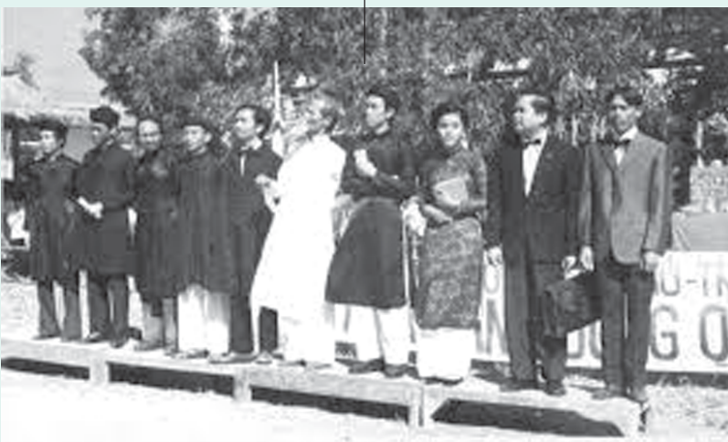
Các sĩ phu thành lập Đồng Kinh Nghĩa Thục năm Đinh Mùi 1907. Ảnh tư liệu.

* Ất Mùi 2015: Cả nước bước vào xuân mới với những thành tựu to lớn, chuyển biến tích cực về kinh tế, văn hóa, xã hội, khoa học - công nghệ. Cũng năm nay, chúng ta đón mừng nhiều lễ kỷ niệm trọng đại: 125 năm ngày sinh Chủ tịch Hồ Chí Minh (1890-2015), 85 năm thành lập Đảng (1930-2015), 70 năm Quốc khánh (1945-2015), 60 năm giải phóng hoàn toàn miền Bắc (1955-2015), 40 năm giải phóng miền Nam và thống nhất đất nước (1975-2015)... ■