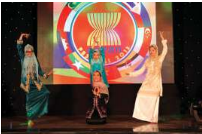
SV các nước ASEAN tham gia Festival tại ĐHQG-HCM.

A EC sẽ là một nhân tố rất quan trọng (cùng với trụ cột chính trị - an ninh, văn hóa - xã hội) làm thay đổi diễn tiến phát triển của kinh tế khu vực Đông Nam Á nói riêng, diện mạo của ASEAN nói chung.