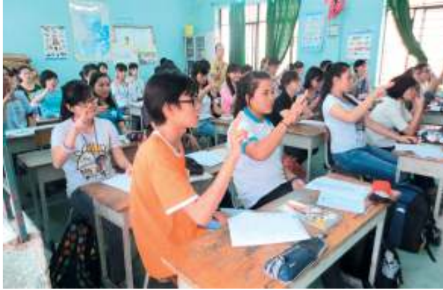
Học NNKH tại Trung tâm Nghiên cứu Giáo dục Người khiếm thính CED TP.HCM.