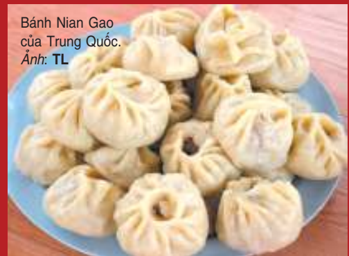
Bánh Nian Gao của Trung Quốc.

Thực đơn ngày Tết của người Trung Quốc đa phần là các loại bánh. Trong đó đáng chú ý có bánh tổ (Nian Gao) được làm từ gạo nếp loại tốt, cùng với đường và một chút gừng tươi. Theo tiếng Trung, "Gao" là bánh, "Nian" là chất dính, nghĩa là bánh nếp, bánh dính, mọi người dùng món bánh này với mong ước các thành viên trong gia đình lúc nào cũng luôn gắn bó bên nhau.