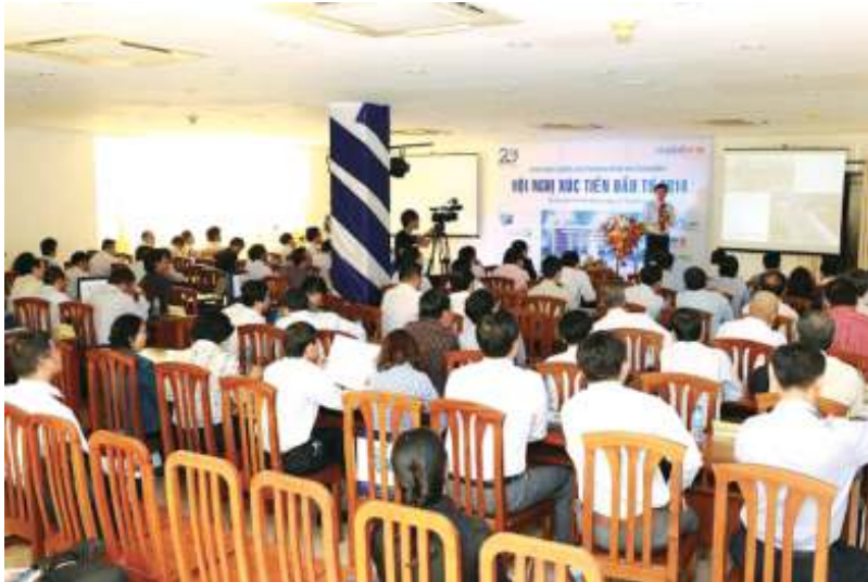
Chủ tọa đoàn điều khiển Hội nghị.