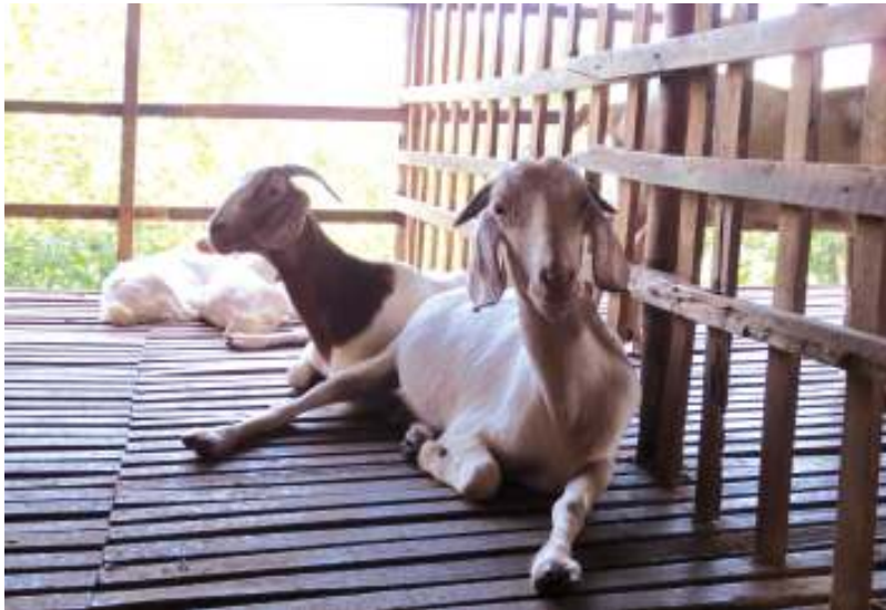
Giống dê Boer và giống dê Boer lai dê Bách thảo.