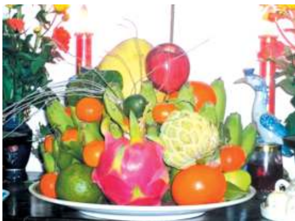
Mâm ngũ quả của Việt Nam.