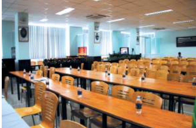
Phòng học Hoa Sen được trang bị các thiết bị hiện đại.