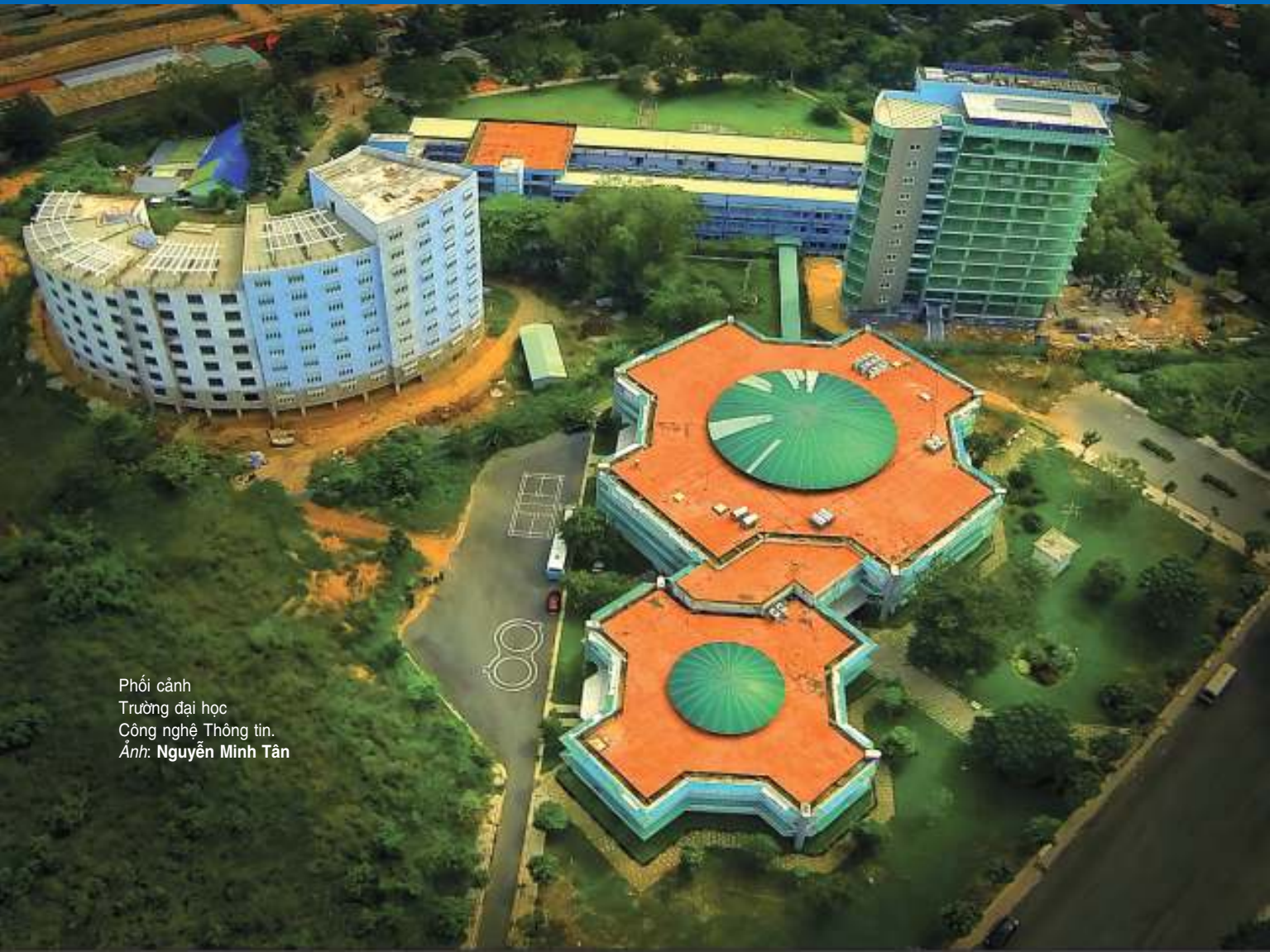
Phối cảnh Trường đại học Công nghệ Thông tin.