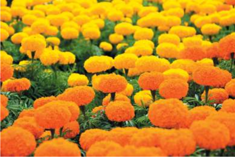
Ảnh minh họa: Nguồn Internet.

giờ sáng mẹ đã lọ mọ đi cấy thuê còn chị em tôi tới bảy, tám giờ vẫn cuộn tròn trong chăn ấm. Hai gót chân của mẹ nẻ nứt, cứ tối lại đau nhức, chảy cả máu... Tôi đâu có biết tại sao Tết nào mấy chị em tôi cũng có áo mới để diện đi chơi, còn bố mẹ thì cũng chỉ mấy bộ đồ cũ mặc quanh năm. Tôi ngu ngơ hỏi: Sao đi đâu mẹ vẫn cứ mặc cái áo cũ mà không mặc cái áo mới chị mua cho? Rồi tôi cũng ngu ngơ tin lời mẹ nói: Tau mặc áo cũ quen rồi, đi mô mặc áo mới khó chịu lắm, không quen!