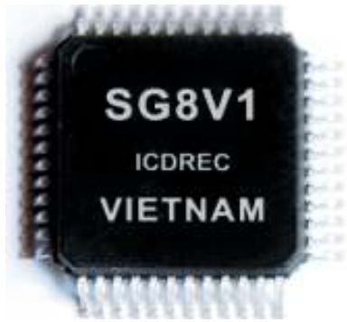
Chip SG8V1.

Sau gần 10 năm hoạt động, Trung tâm ICDREC đã cho ra đời sản phẩm chip vi điều khiển 8-bit thương mại đầu tiên của Việt Nam mang thương hiệu ĐHQG-HCM có tên là SG8V1.