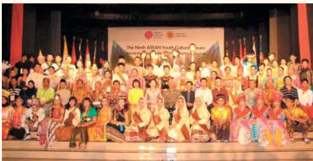
SV ĐHQG-HCM tham gia Diễn đàn Văn hóa Thanh niên Đông Nam Á, lần IX.

SV bây giờ muốn đa năng để có nhiều cơ hội việc làm hơn, nên trong chương trình đào tạo chúng tôi cũng có xu hướng tích hợp báo chí với các kỹ năng truyền thông, marketing, PR ■