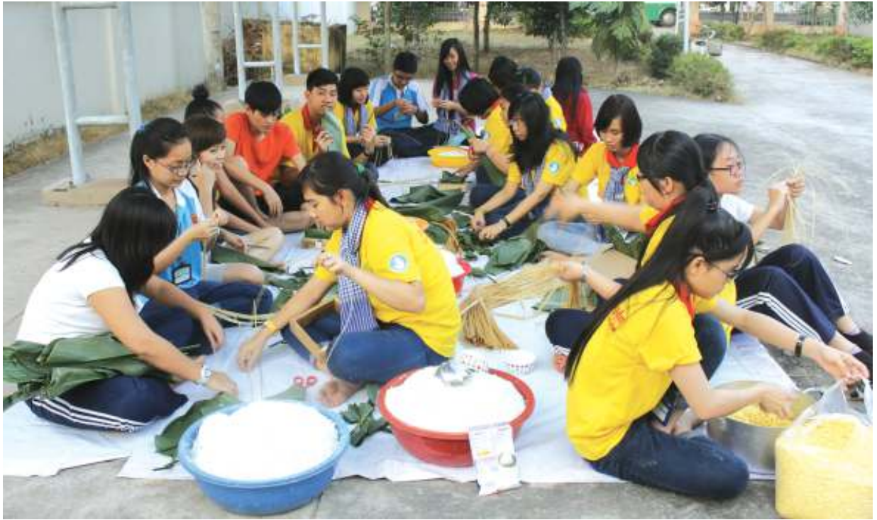
Gói bánh chưng là kỹ năng cần có của chiến sĩ XTN.